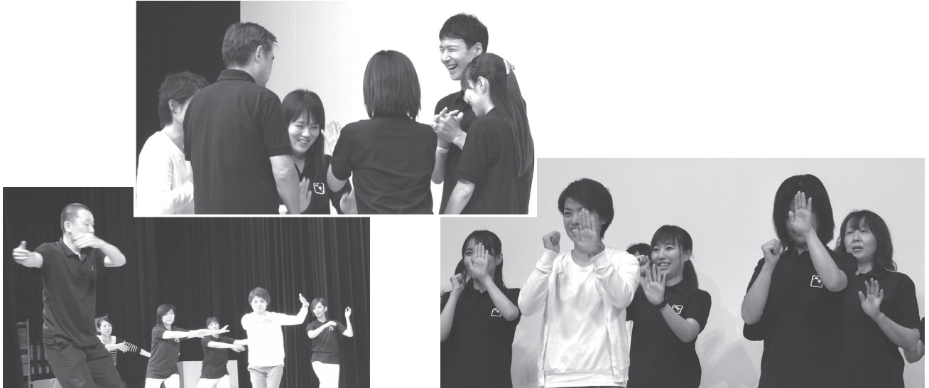
転倒予防実践セミナー